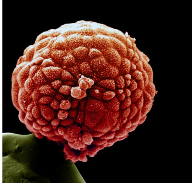
Blastula—de sfeer van het beginnend menskind

Op de diepste werkelijkheid van ieder geschapen ding heeft Hij het licht van één Zijner namen laten schijnen en het ontvankelijk gemaakt voor de heerlijkheid van één van Zijn hoedanigheden. Op de wezenlijkheid van de mens echter richtte Hij de glans van al Zijn namen en hoedanigheden en maakte hem tot een spiegel van Zijn eigen wezen.