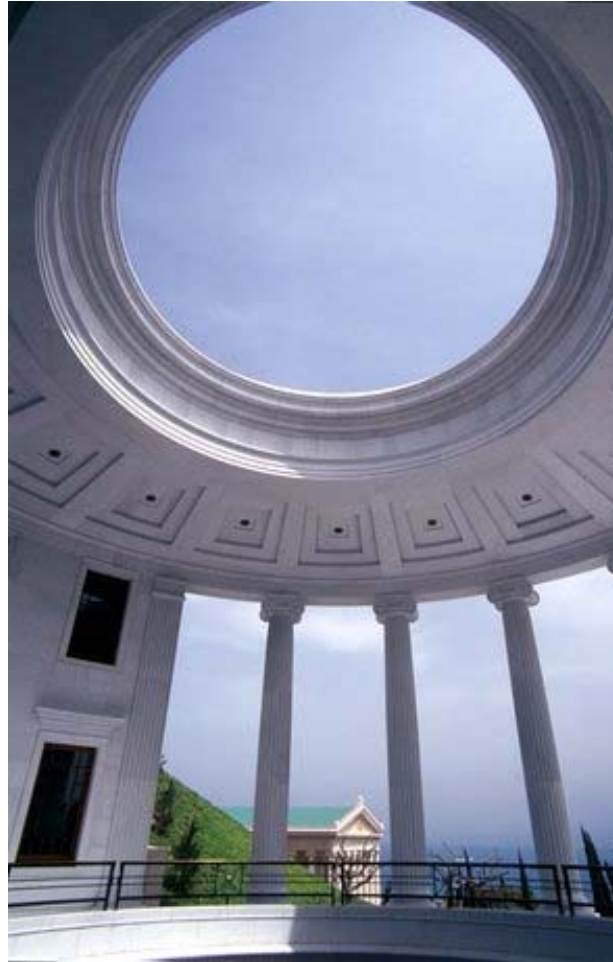
Voorhof van een van de gebouwen van het Bahá'í-wereldcentrum.

Er wordt nog steeds wereldpolitiek gemaakt op basis van een statenorde uit het verleden. Maar dreigende wereldproblemen dwingen ons de oude utopie van de wereldvrede te verwezenlijken. De volkeren zullen zich in een wereldstaat organiseren en uiteindelijk de "Allergrootste Vrede" weten te stichten. Bahá'u'lláh openbaart het daaraan ten grondslag liggende "Goddelijke Plan".